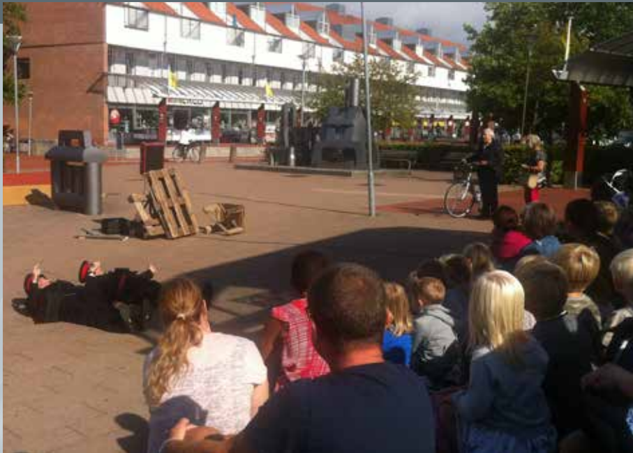
Gadeteater på Værløse Bymidte august 2016.

flere spændende familieforestillinger, Egnsteatret Undergrunden, Farum Kulturhus' Børneteater, Værløse Børneteater og Ældresagen i Farum.